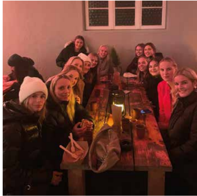
Eure 1. Damen