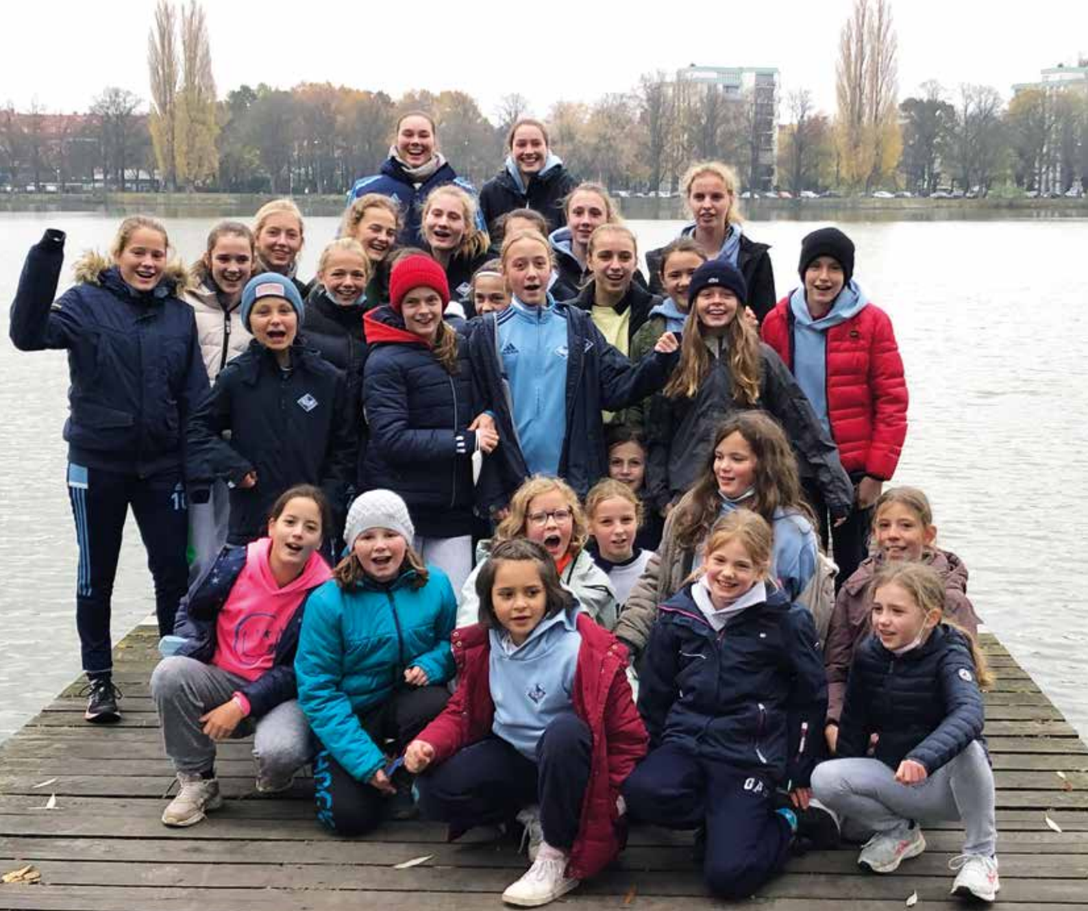
Spaziergang am Maschsee – alle zusammen mit Bibi und Tina aus der Box