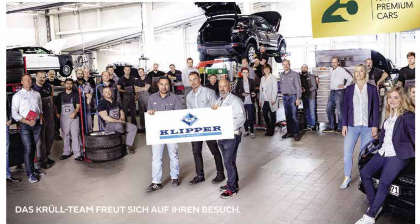
DAS KRÜLL-TEAM FREUT SICH AUF IHREN BESUCH.

Das „Premium“ in unserem Namen steht nicht nur für die Qualität unserer Fahrzeuge. Bei Krüll Premium Cars stehen Sie – unsere Kunden – an erster Stelle. In unserem modernen Flagship-Store am Rondenborg erwartet Sie nicht nur Norddeutschlands größte Jaguar und Land Rover Ausstellung, sondern auch ein exklusiver Service, der allen Wünschen und Ansprüchen gerecht wird: