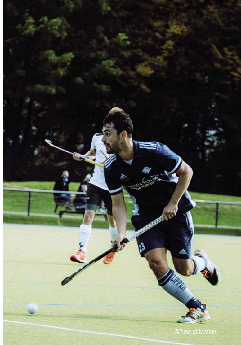
@Time of Motion