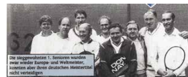
Die sieggewohnten 1. Senioren wurden zwar wieder Europa- und Weltmeister, konnten aber ihren deutschen Meistertitel nicht verteidigen.

Die Mitglieder und Nachfolger der ruhmreichen Mannschaft wollten in diesem Jahr in der neugegründeten Liga 80 spielen. Leider kam die Corona-Pandemie dazwischen. Die Spiele der Herren 80 mussten ausfallen. Als die Punktspiele mit Hygie-