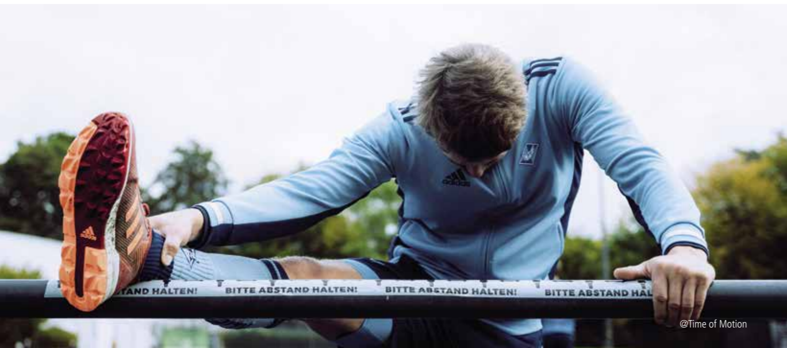
@Time of Motion

den Hockeyplatz dürfen. Wir freuen uns darauf Euch alle hoffentlich bald wieder im Klipper und bei unseren Heimspielen zu sehen! Bis dahin wünschen wir Euch ein besinnliches Weihnachtsfest und vor allem: Bleibt gesund! Eure 1. Herren