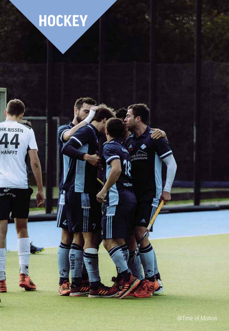
@Time of Motion