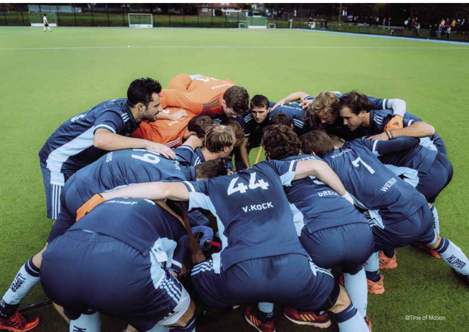
@Time of Motion

entschieden (gegen DHC Hannover, Schwarz-Weiss Koeln und Gladbacher HTC), 4 Niederlagen (Düsseldorfer HC, DSD Düsseldorf, Schwarz-Weiss Neuss und Marienburger SC) sowie 1 Derbysieg zu Hause gegen den THK Rissen (4:0). Immer wieder haben wir in Ansätzen zeigen können, welches Potential in unserem Kader steckt. Letztlich ist es uns aber leider zu selten gelungen, über 60 Minuten an unsere Leistungsgrenze zu gehen und die vielen guten Spiele die wir hatten, in Zählbares umzumünzen.