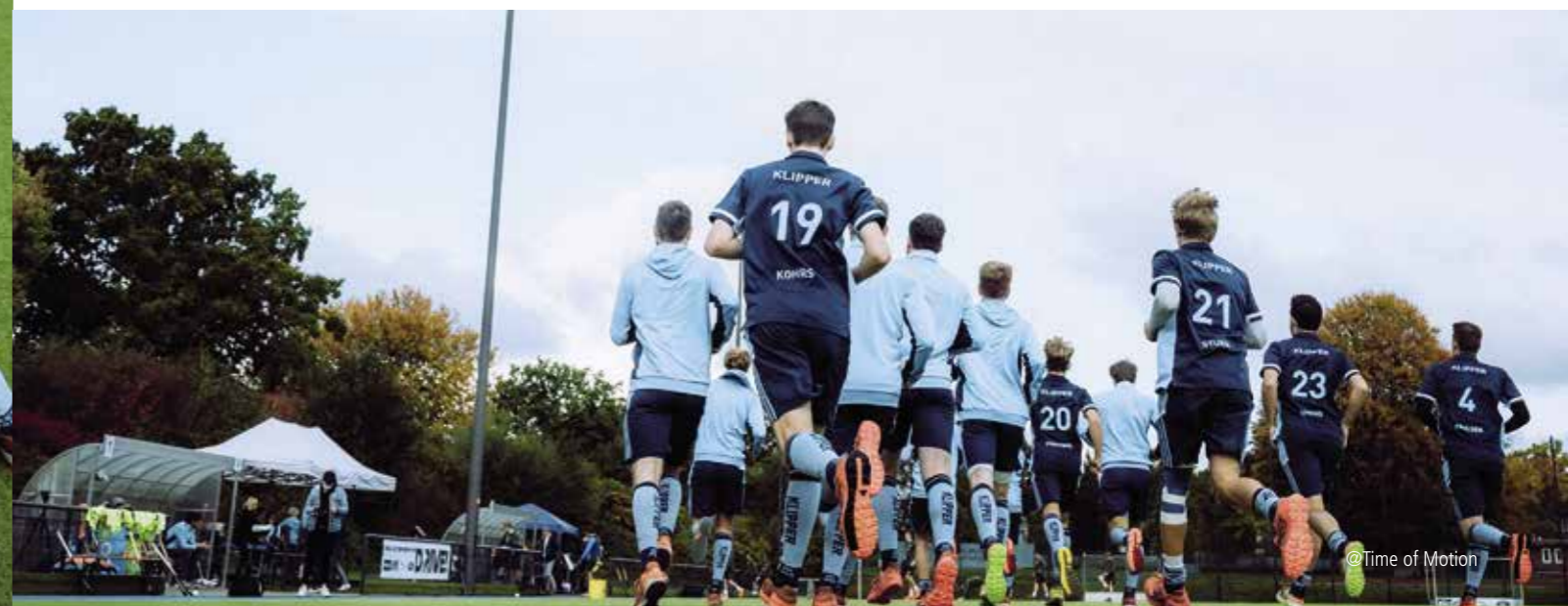
@Time of Motion