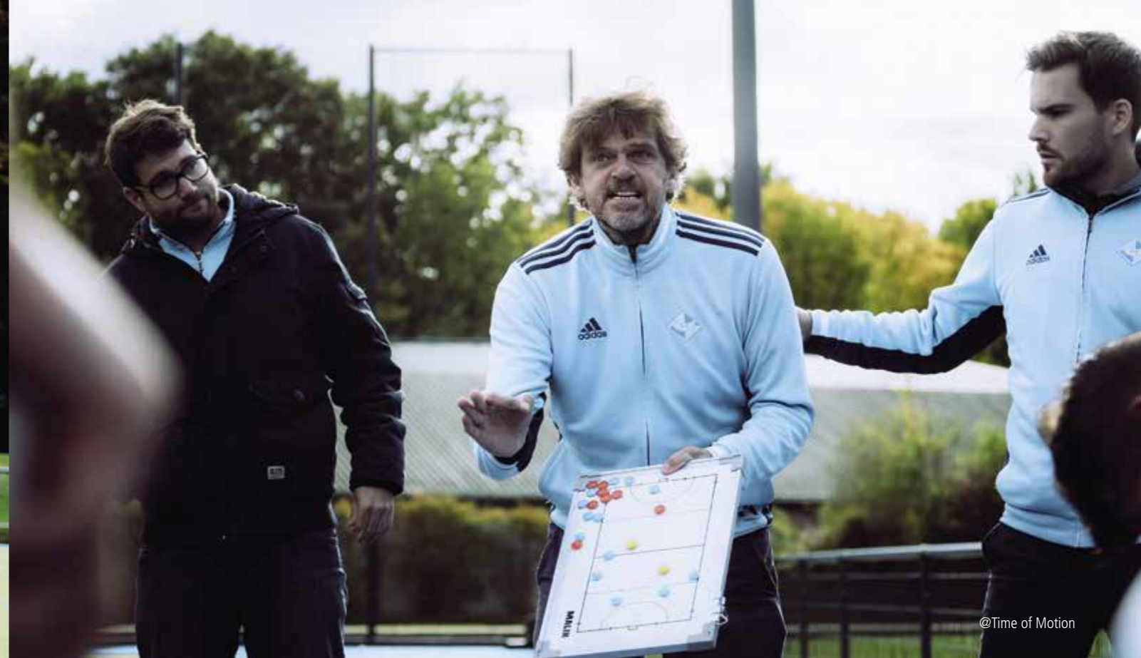
@Time of Motion