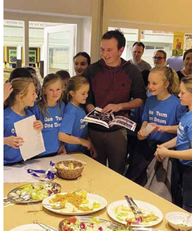
Deine 2009er Mädchen