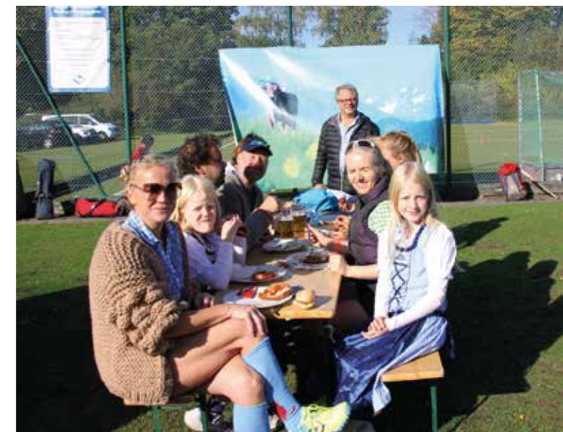
Die Uhlenmixer vom UHC