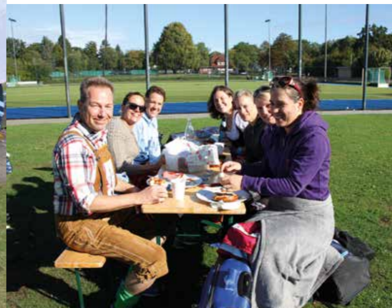
Kir Royal, der spätere Turniersieger bei einer zwischenzeitlichen Stärkung