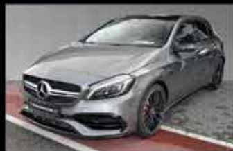
Mercedes-AMG A 45 4MATIC

EZ 09/2017, 8.114 km, 381 PS, NP 63.540,- € 53.999,- €*