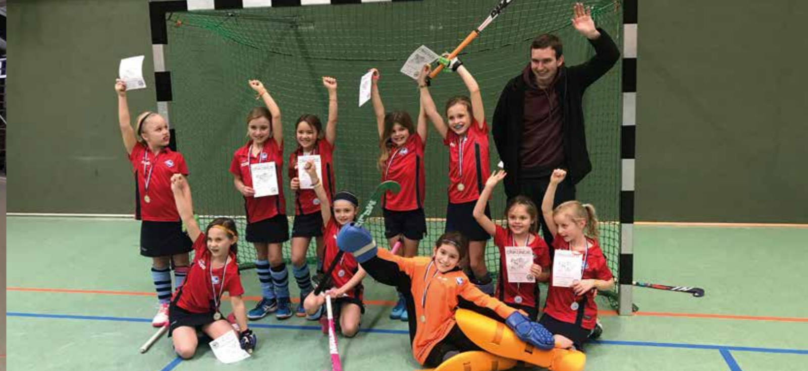
Glückliche Gewinner beim Troll-Turnier in Celle, Januar 2018