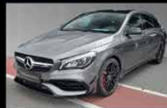
Mercedes-AMG CLA 45 4MATIC SB

EZ 06/2017, 8.710 km, 381 PS, NP 71.192,- € 56.999,- €*