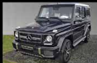
Mercedes-AMG G 63

EZ 04/2016, 17.768 km, 571 PS, NP 168.052,- € 129.890,- €*