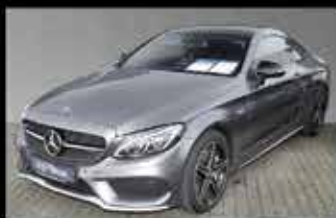
AMG C 43 Coupé

EZ 07/2017, 16.062 km, 367 PS, NP 69.496,- € 57.900,- €*