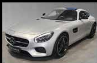
Mercedes-AMG GT S

EZ 01/2015, 9.238 km, 510 PS, NP 163.470,- € 124.900,- €*