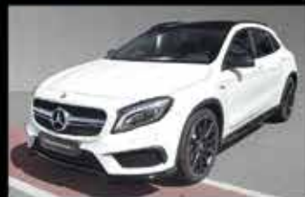
Mercedes-AMG GLA 45 4MATIC

EZ 05/2017, 8.031 km, 381 PS, NP 79.390,- € 53.999,- €*