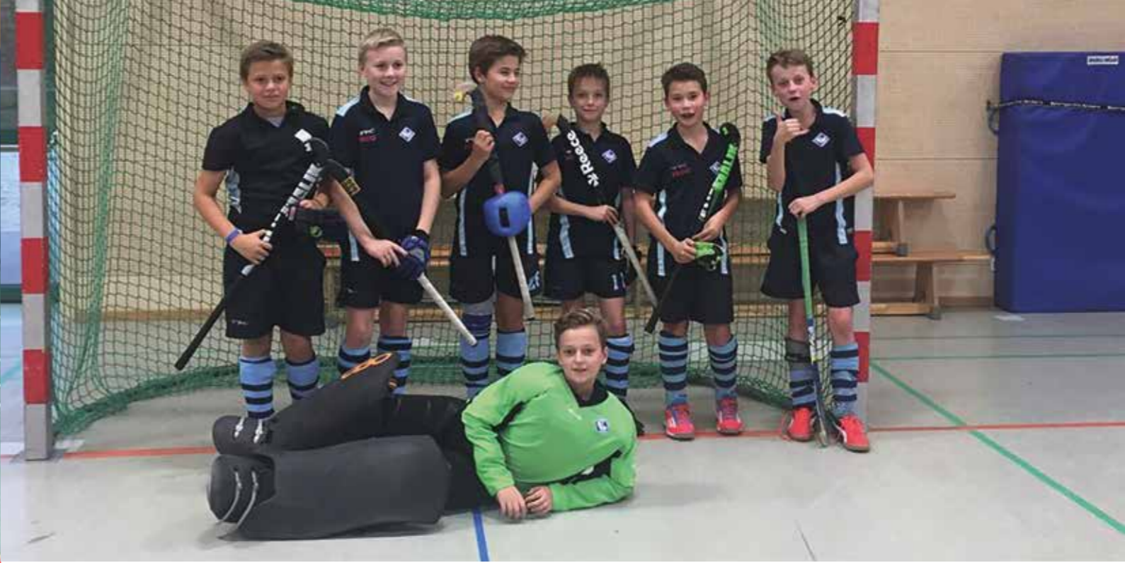
2. Platz in Braunschweig