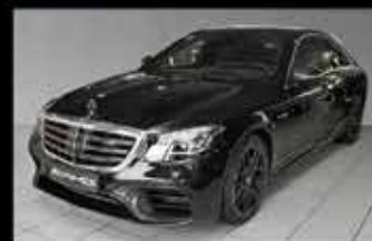
Mercedes-AMG S 63 4MATIC

EZ 10/2017, 8.413 km, 612 PS, NP 224.797,- € 182.999,- €*