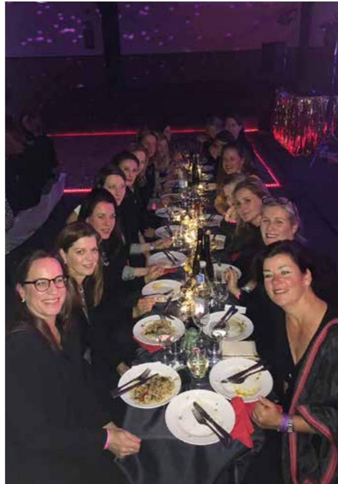
Die Schlenz Angels